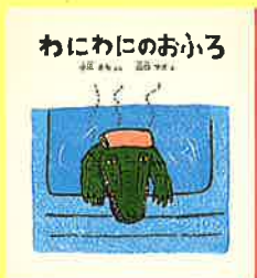
「わにわにのおふる」福音館書店