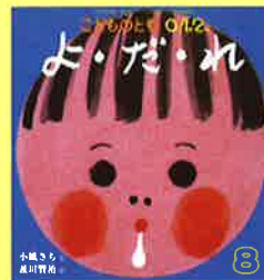
「よ・だ・れ」福音館書店