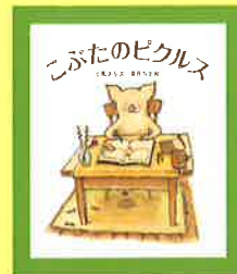
「こぶたのピクルス」福音館書店