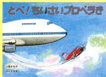
「とべ!ちいさいプロペラき」福音館書店